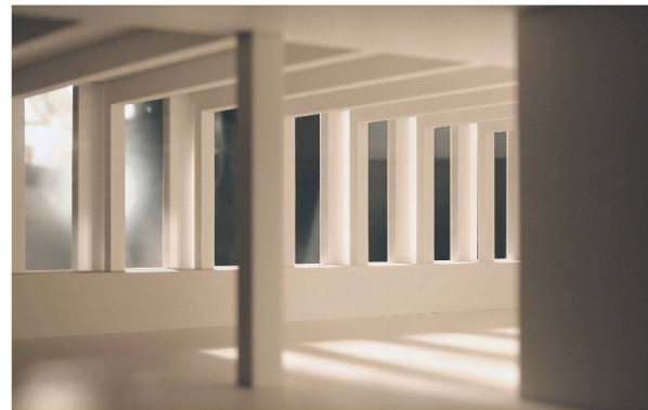
Der Lichteinfall ist unter dem Lichtdom gut sichtbar.