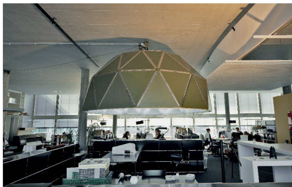
Der Tageslichtdom in der Räumlichkeiten von Reflexion.

5 Verhältnis der Beleuchtungsstärke im Raum zu derjenigen draussen bei bedecktem Himmel.