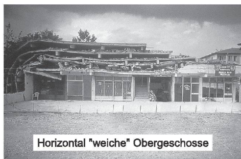
Horizontal "weiche" Obergeschosse