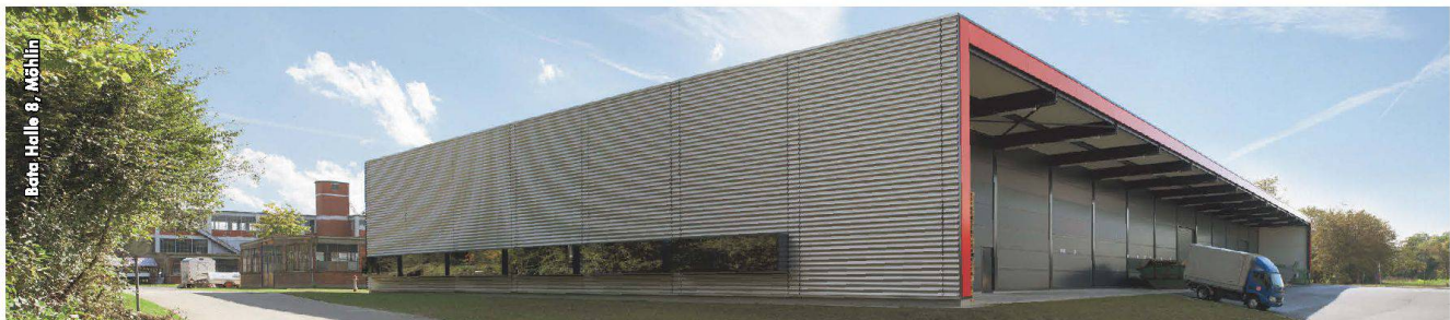
Betre Halle 8, Möhlin

JAKEM AG Industrie Breitenloh 2 CH-4333 Münchwilen