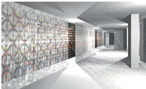
Präsentation von Création Baumann , gestaltet von Benjamin Thut .

1./2. November 2014, Langenthal. Shuttlebusse und ausgeschilderte Fusswege bringen die Besucher zu den verschiedenen Standorten. www.designerssaturday.ch