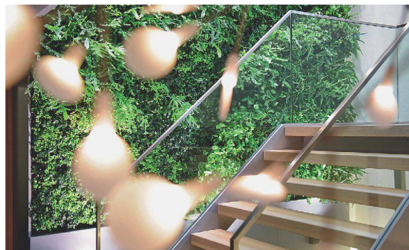
Hydroplant präsentiert sich am Standort Glas Trösch .