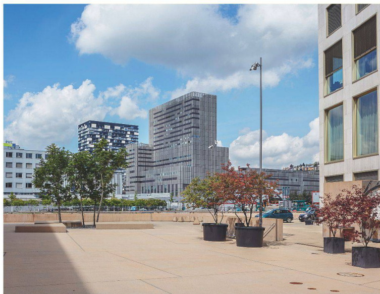
Eitel Sonnenschein über Zürichs Westen. Die im frisch umgebauten Toni-Areal eingezogene Zürcher Hochschule der Künste soll das Quartier zwischen Büros und Luxuswohnungen beleben.