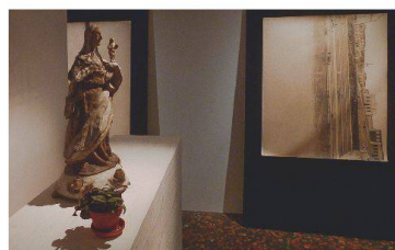
10.10.2014 Ausstellung «Lina Bo Bardi» Eine Ausstellung über die italienisch-brasilianische Architektin zeigt das Zürcher Johann Jacobs Museum. Wir haben uns umgesehen. www.espazium.ch/tec21