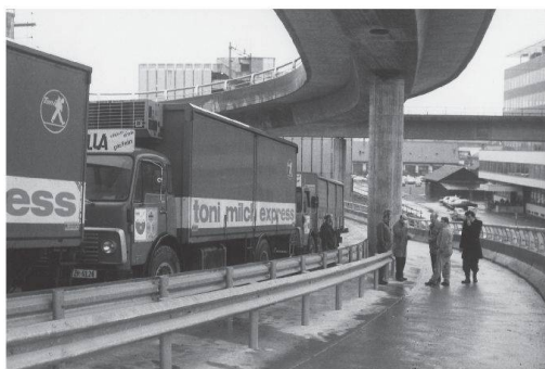
Nachdem die Rampe erstellt war, führte die Empa am 21. Januar 1975 Belastungsversuche durch.

Gebäudebewegungen infolge Schwind- und Kriechverkürzungen des Betons zu rechnen – vor allem auch aufgrund unterschiedlicher Temperaturen, denn das Kühllager sollte bis -30^{\circ}\text{C} heruntergekühlt werden können, während an Sommertagen durchaus mit Ausstemperaturen von bis zu +30^{\circ}\text{C} zu rechnen war.