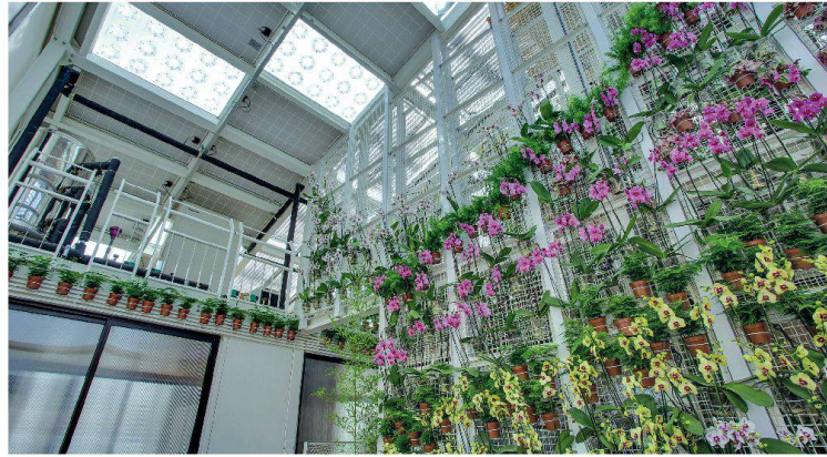
Das «Orchid House» vom Team der National Chiao Tung University Taiwan belegte den ersten Platz in der Kategorie Städtebau . Der Entwurf orientiert sich an Orchideen, die hoch auf Bäumen wachsen und von Sonnenlicht und Regenwasser leben. Analog zu den Blumen kann der leichtgewichtige Prototyp bestehende urbane Gebäude aufstocken, er wird über eine Photovoltaikanlage mit elektrischer Energie versorgt und nutzt Regenwasser zur Verdunstungskühlung sowie zur Tröpfchenbewässerung des vertikalen Grüns.