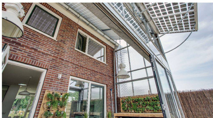
Das Projekt «Home with a skin» gewann den ersten Preis für Nachhaltigkeit . Ziel des Teams aus Delft war es, niederländische Reihenhäuser aus den 1960er-Jahren auf den neuesten Stand der Technik zu bringen. Die Altbauten werden mit einer neuen Gebäudehülle überzogen, sodass zusätzlicher Wohnraum gewonnen und gleichzeitig der Energieverbrauch aus erneuerbaren Quellen gedeckt wird.