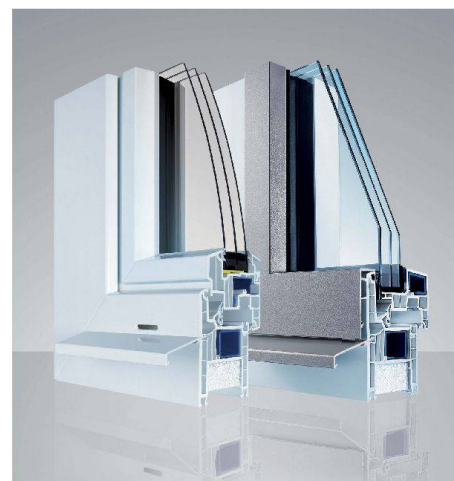
EgoKiefer Kunststoff- und Kunststoff/Aluminium-Fenster AS1®

Für weitere Ausführungen jetzt Unterlagen bestellen und CAD-Vorlagen für Ihre Planung downloaden unter www.egokiefer.ch .