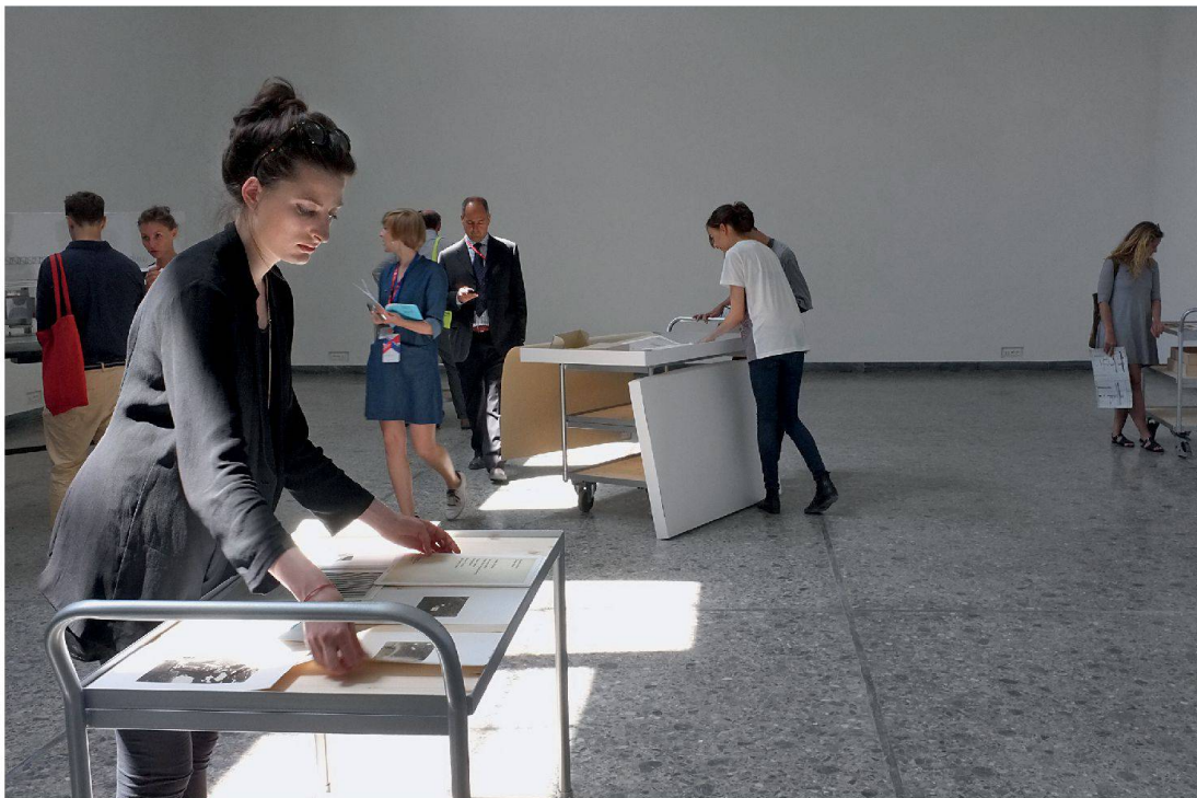
Studierende der ETH Zürich präsentieren Faksimile aus den Archiven von Cedric Price und Lucius Burckhardt . Die Archivmöbel stammen von Herzog & de Meuron.