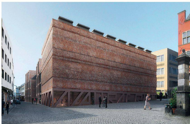
Architekturexport: Christ&Gantenbein Architekten aus Basel gewannen den Wettbewerb für die Erweiterung des Kölner Wallraf-Richartz-Museums & Fondation Corboud.

stellen. Ein entsprechender Antrag wurde zuhause der Delegiertenversammlung vom 23. Mai 2014 eingereicht und von dieser genehmigt.