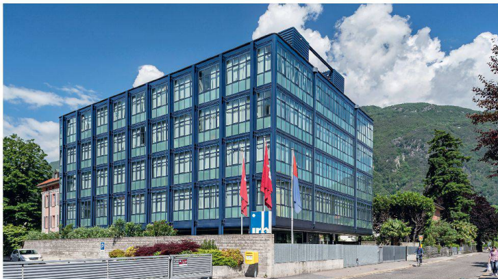
Das Institut für Biomedizinische Forschung in Bellinzona, 1965 errichtet nach Plänen von Luigi Snozzi und Livio Vacchini.

Die Praxis zeigt aber, dass sich die Begleitperson ihrer Verantwortung häufig nicht bewusst ist und den