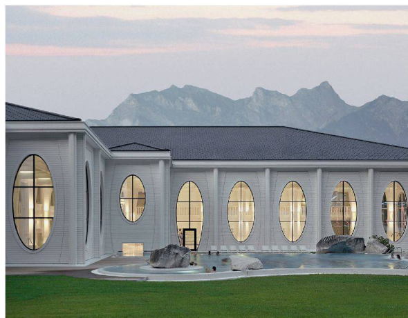
Provoziert: Die Tamina Therme in Bad Ragaz zeigt Haltung und eckt an.

seiner Erneuerung abhandeln gekommen, und der Aussenraum sollte nun das leisten, was der Architektur nicht gelang: dem Geviert einen Charakter geben.