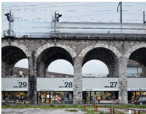
Die Geschäfte unter den Viaduktbögen in Zürich stehen für hipbes Kleinbewerbe in einem angesagten Quartier.