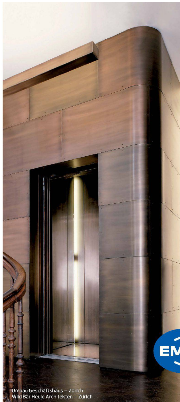
Umbau Geschäftshaus – Zürich Wild Bär Heule Architekten – Zürich