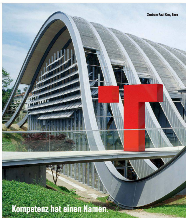
Zentrum Paul Klee, Bern

Projektziele gemeinsam erreichen setzt eine straffe Organisation und die Ein- haltung der Kosten voraus. Fragen Sie uns an.