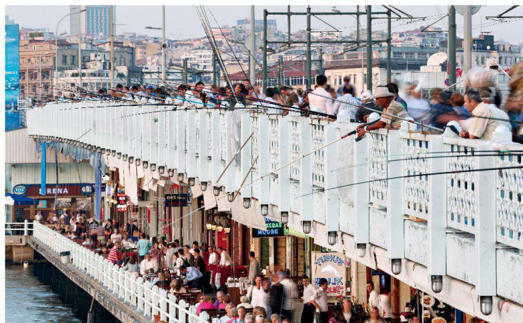
Die belebte Galatabrücke über das Goldene Horn in Istanbul.