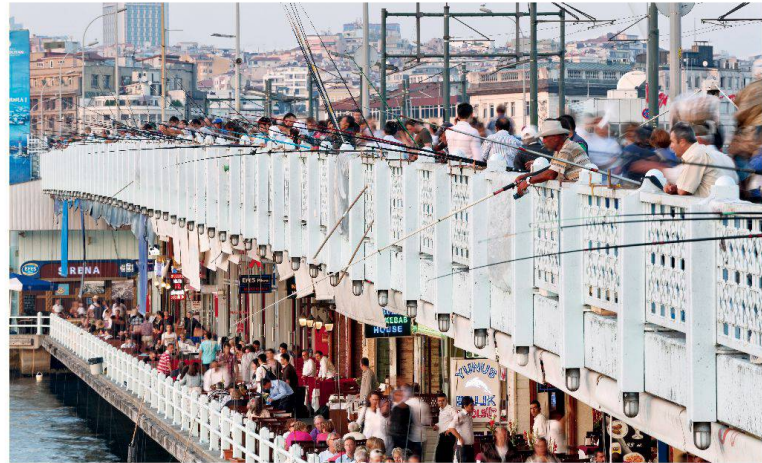
Die belebte Galatabrücke über das Goldene Horn in Istanbul.