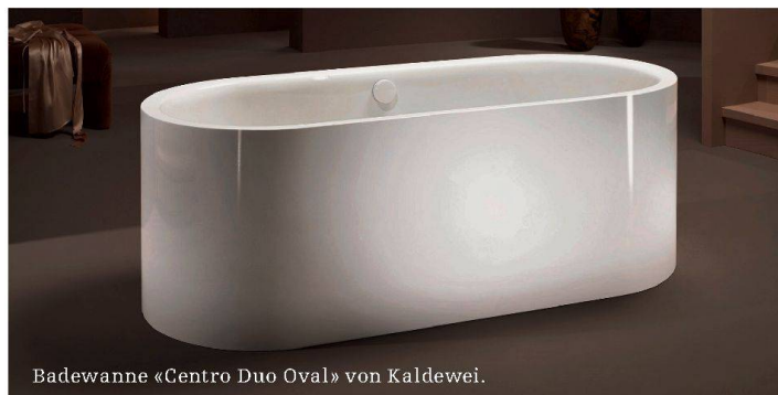
Badewanne «Centro Duo Oval» von Kaldewei.