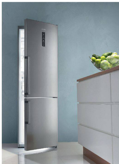
Gorenje NRK von Sibir.