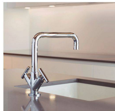
«Arwa Twinprime» von Similor.