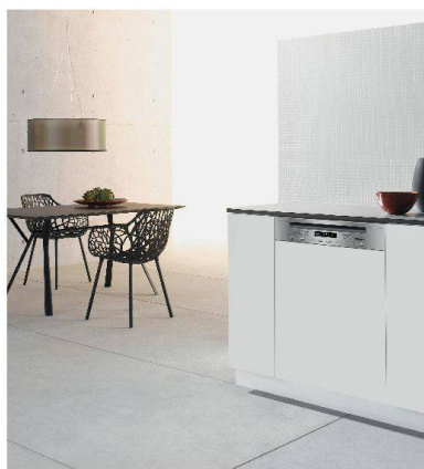
Geschirrspüler «SMS» von Miele.