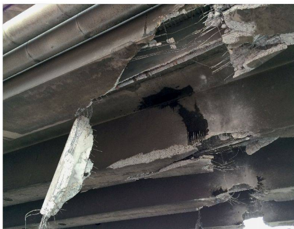
Der Ausleger zerschneidet die Hohlkastenträger. Die Hüllrohre mit den Vorspannkabeln wurden freigelegt, aber nicht verletzt.