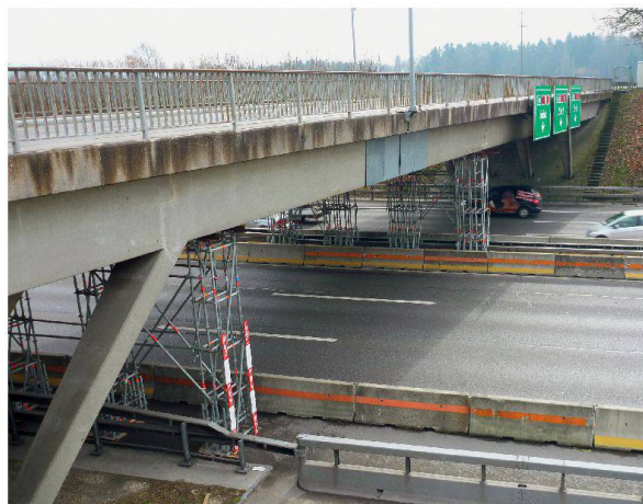
Die Sicherung besteht aus Gerüsten mit Anprallschutz auf den Mittel- und Pannestreifen sowie Abdeckblechen beim Schaden.