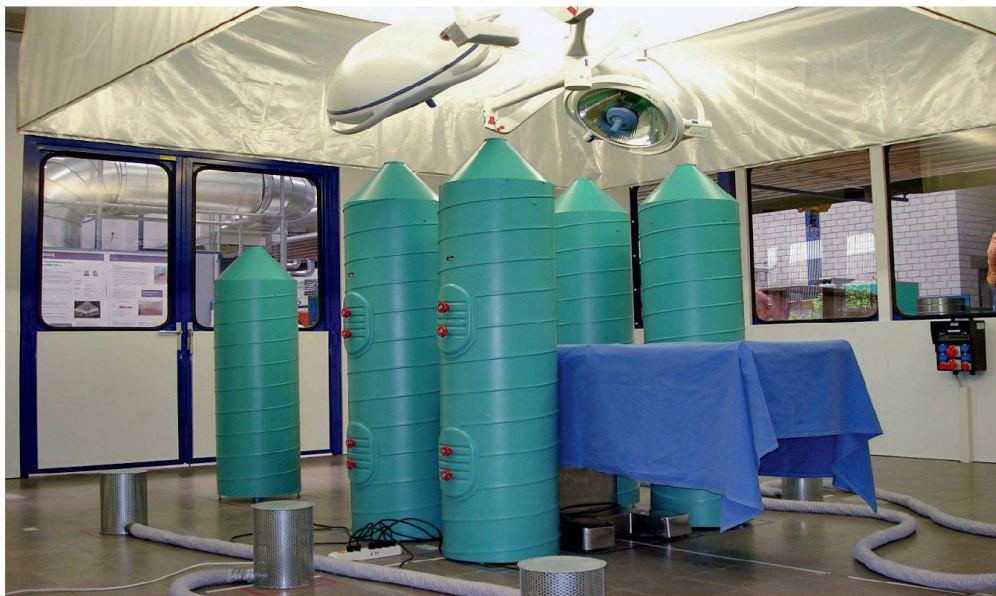
Im 1:1 nachgebauten Operationssaal im ZiG-Labor stehen medizinisch-technisches Equipment und Dummies für die Ärzte. Während des Prüfverfahrens messen Sensoren die Partikelkonzentration an verschiedenen Stellen.

In der Standardkonfiguration erfolgt die Zuluft gleichmässig über dem Operationsfeld. Die Abluft wird seitlich an den Wänden in Bodennähe abgeführt.