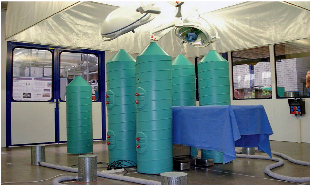
Im 1:1 nachgebauten Operationssaal im ZiG-Labor stehen medizinisch-technisches Equipment und Dummies für die Ärzte. Während des Prüfverfahrens messen Sensoren die Partikelkonzentration an verschiedenen Stellen.

In der Standardkonfiguration erfolgt die Zuluft gleichmässig über dem Operationsfeld. Die Abluft wird seitlich an den Wänden in Bodennähe abgeführt.