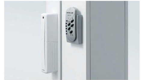
Motorantrieb für automatisches Öffnen und Schliessen von Hebeschiebetüren.

Für weitere Ausführungen jetzt Unterlagen bestellen und CAD-Vorlagen für Ihre Planung downloaden unter www.egokiefer.ch .