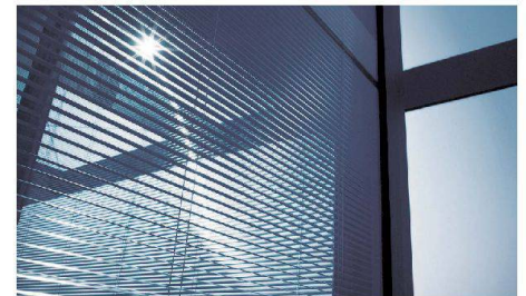
Sonnenschutz der Zukunft: ins Isolierglas integrierte Jalousie.