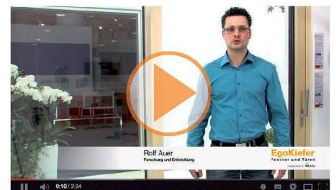
EgoKiefer Holz/Aluminium Hebeschiebetüre XL®2020 und EgoKiefer Kunststoff/Aluminium Hebeschiebetüre XL®2020.

Zu den Produktvideos: www.egokiefer.ch/innovationen