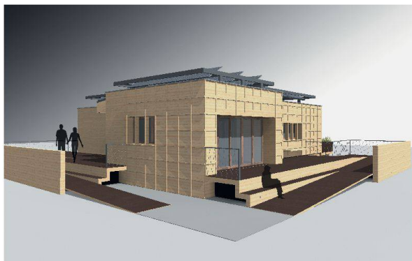
Die naturnahe Hülle aus Holz enthält jede Menge Gebäudetechnik.