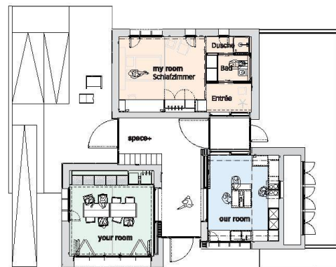
Die vier Raumtypen des Prototyps.