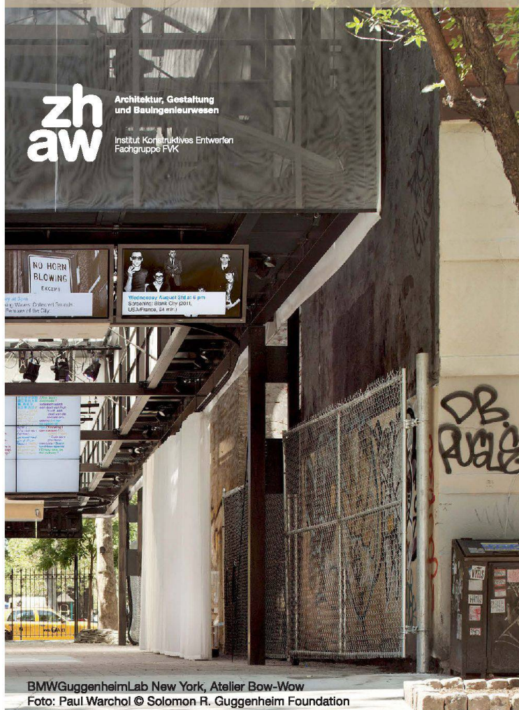
BMW Guggenheim Lab New York, Atelier Bow-Wow

Mittwoch, 26. März 2014 | ZHAW Winterthur