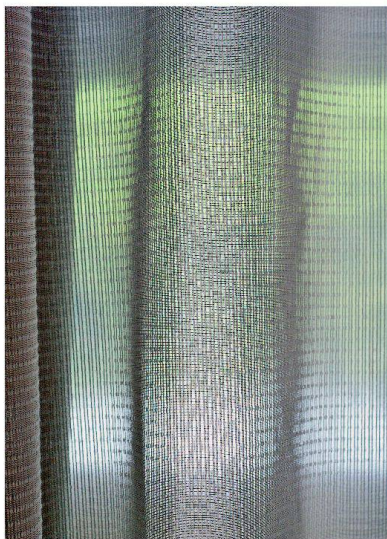
Transparenter Akustikstoff «Betacoustic» von Création Baumann.