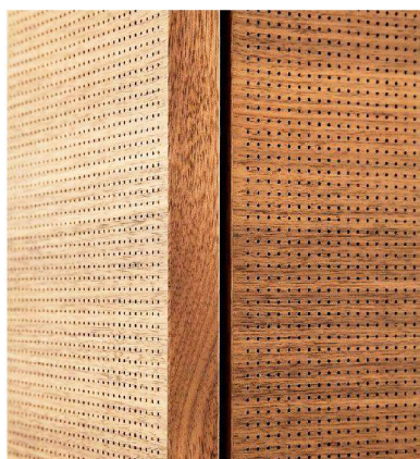
Neuer, mikroperforierter Absorber mit Holzoberfläche von Strähle.