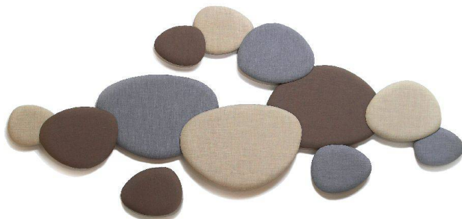
«Satellite» von Stua gibt es in vier Grössen und vielen Farben.