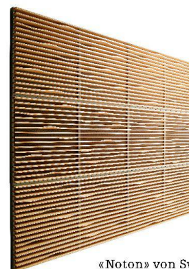
«Noton» von Swedese.