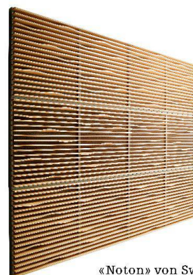
«Noton» von Swedese.