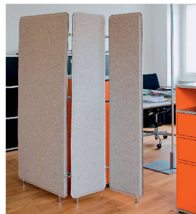
Ruckstuhls «Pannelo Paravent».