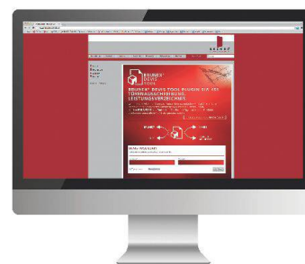
Vereinfacht die Ausschreibung: das Devis-Tool von Brunex.

Brunex lancierte auf der Messe den Devis-Tool-Produktkonfigurator für Architekten und Planer. Damit können die Türen aus dem gesamten Brunex-Sortiment vollständig gemäss NPK 622 konfiguriert werden. Das Tool importiert die Ausschreibungstexte über die Schnittstelle SIA 451 automatisch in die richtige NPK-Position; das vereinfacht die Ausschreibung wesentlich. Dank der Zusammenarbeit mit der Schweizerischen Zentralstelle für Baurationalisierung CRB ist das Devis-Tool Bestandteil der Produktdatenplattform PRD. Deren Nutzer können so direkt auf die Brunex-Produkte zugreifen und sie mit dem Tool planmässig konfigurieren. • www.brunex.ch