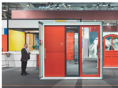
Im Mondrian-Look: der Stand von Feuerschutz Team.

Aktuelle Referenzbauten wie der Seniorenpark Weissenau Unterseen oder die Ecole Internationale de Genève waren am Messestand von Feuerschutz Team die beherrschenden Themen. Darüber hinaus zeigte das Unternehmen Drehflügel- und Schiebetüren gemäss El30-Brandschutzanforderung und mit bis zu 3450 mm Türblatthöhe sowie verglaste El30-Brandschutz-Pendeltüren mit Seitenteilen als Pfostenriegelkonstruktion. • www.feuerschutzteam.ch