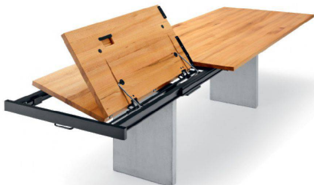
Verlängerbarer Massivholztisch «Bela».