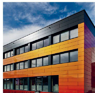
«Alcubond»-Platten sind in verschiedenen Farben erhältlich.