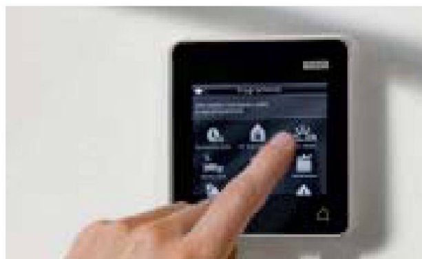
La nouvelle télécommande VELUX INTEGRA® dispose d'un écran tactile qui permet une manipulation intuitive des produits électriques VELUX.

L'étroite collaboration avec la recherche et l'enseignement soutient en effet l'optimisation de nos produits et particulièrement l'amélioration du confort de l'habitation. Les coopérations avec des écoles d'architecture et d'autres institutions nous permettent également de maintenir un dialogue sur l'architecture contemporaine avec les générations actuelles et futures de professionnels de la construction. Outre le concours « International VELUX-Award » ouvert aux étudiantes et aux étudiants en architecture, il existe divers programmes appliqués par VELUX et de hautes écoles. Dans le cadre du projet « Smart Density », nous analysons avec la Haute École de Lucerne les défis liés à la densification de la const