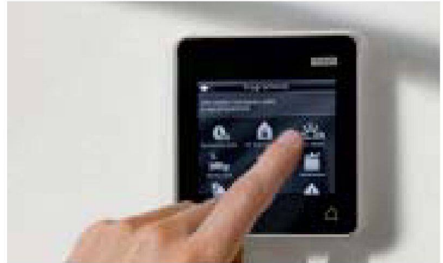
La nouvelle télécommande VELUX INTEGRA® dispose d'un écran tactile qui permet une manipulation intuitive des produits électriques VELUX.

L'étroite collaboration avec la recherche et l'enseignement soutient en effet l'optimisation de nos produits et particulièrement l'amélioration du confort de l'habitation. Les coopérations avec des écoles d'architecture et d'autres institutions nous permettent également de maintenir un dialogue sur l'architecture contemporaine avec les générations actuelles et futures de professionnels de la construction. Outre le concours « International VELUX-Award » ouvert aux étudiantes et aux étudiants en architecture, il existe divers programmes appliqués par VELUX et de hautes écoles. Dans le cadre du projet « Smart Density », nous analysons avec la Haute École de Lucerne les défis liés à la densification de la const