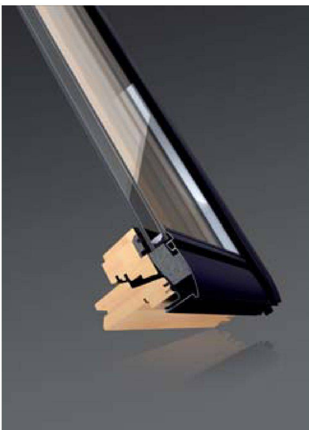
Isolamento termico ottimizzato grazie a VELUX ThermoTechnology™

L'alleanza è un'organizzazione non lucrativa con oltre 40 membri e a cui dà sostegno anche l'Unione Internazionale degli Architetti (UIA). Oltre alla sostenibilità energetica, le «Active Houses» tengono conto anche di numerosi altri aspetti correlati alla sostenibilità. Ad esempio, la flessibilità degli spazi deve consentire l'adeguamento alle condizioni di vita, mantenendo inalterate, nei limiti del possibile, le strutture sociali presenti negli insediamenti da risanare.