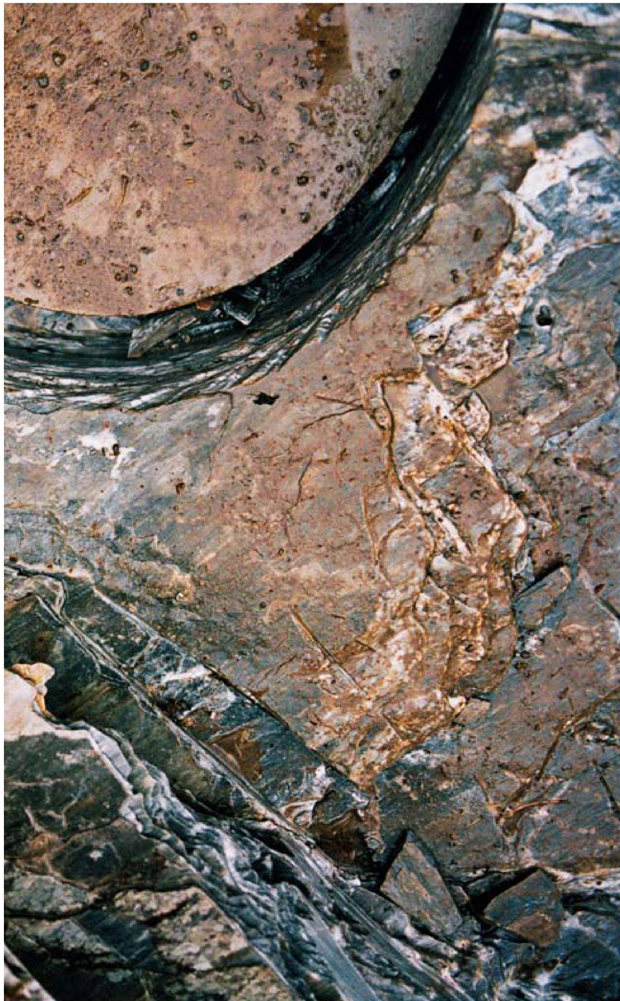
2 Trutg dil Flem, Flims GR