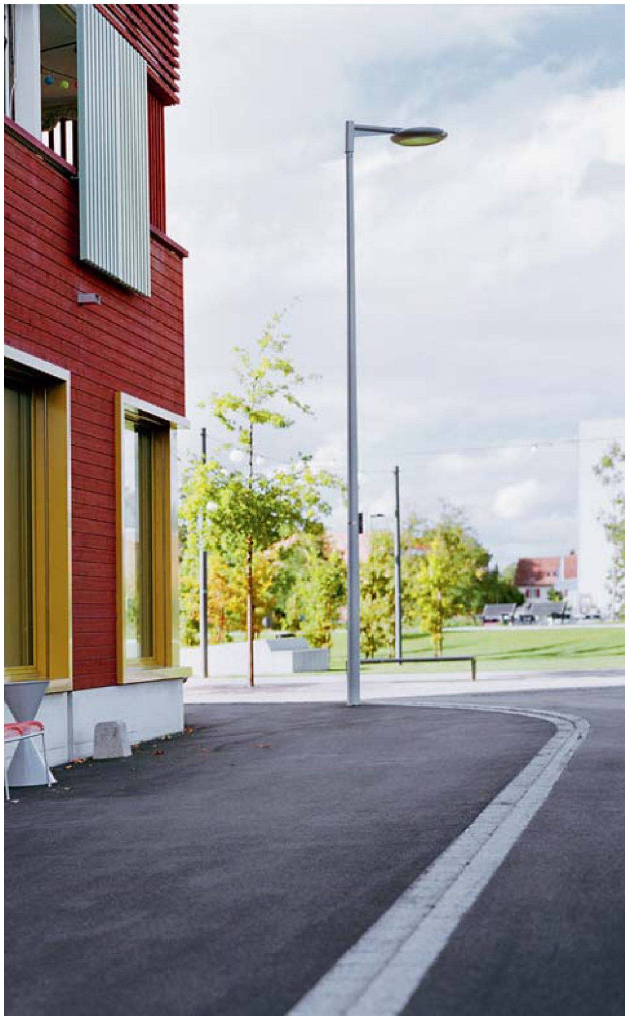
4 Mehrgenerationenhaus «Giesserei», Winterthur ZH | Maison plurigéné- rationnelle «Giesserei», Winterthur ZH | Casa plurigenerazionale «Giesserei», Winterthur ZH