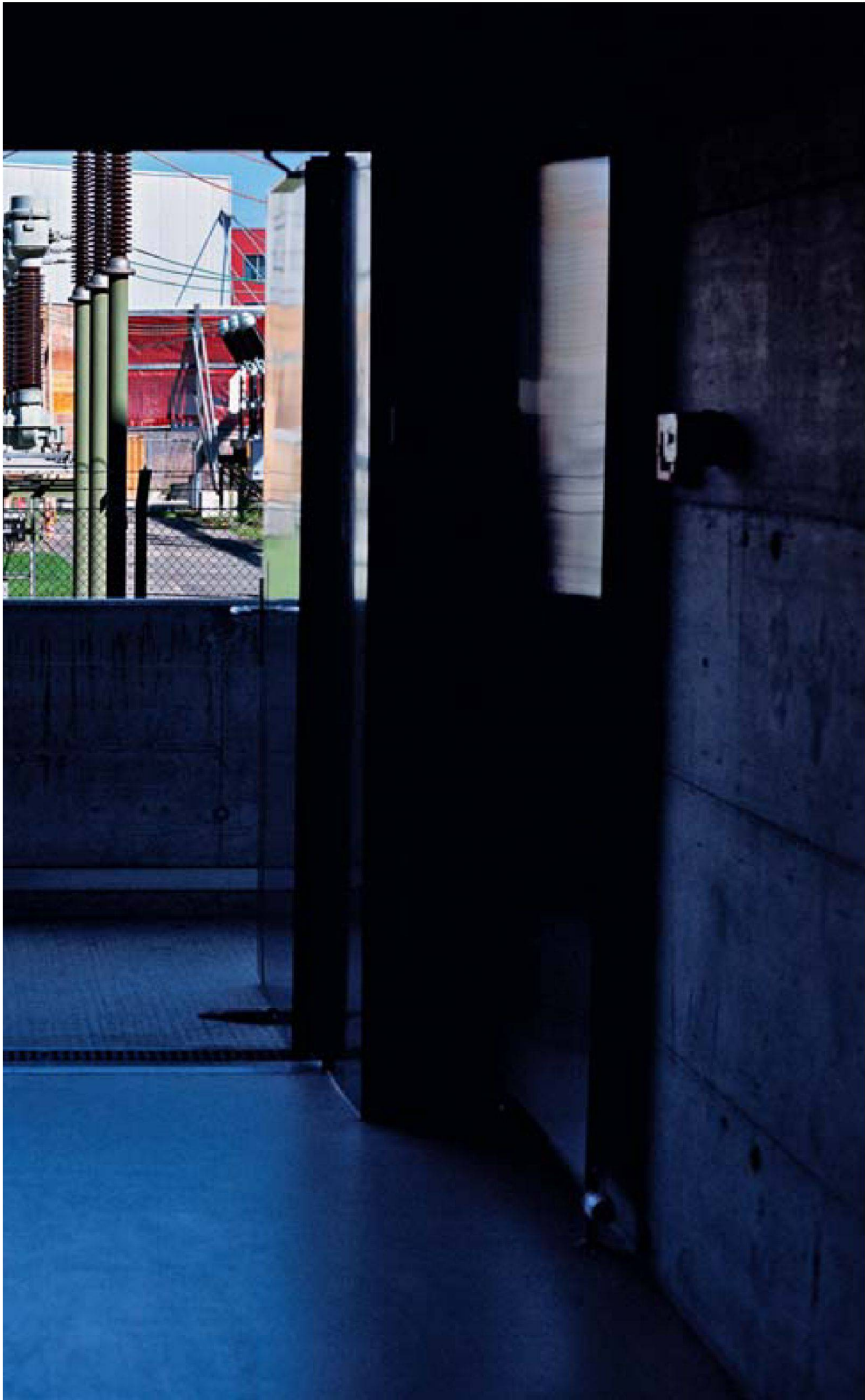
1 Gewerbehaus «Nørd», Zürich Oerlikon | Immeuble artisanal «Nørd», Zurich Oerlikon | Stabile artigiane «Nørd», Zurigo Oerlikon