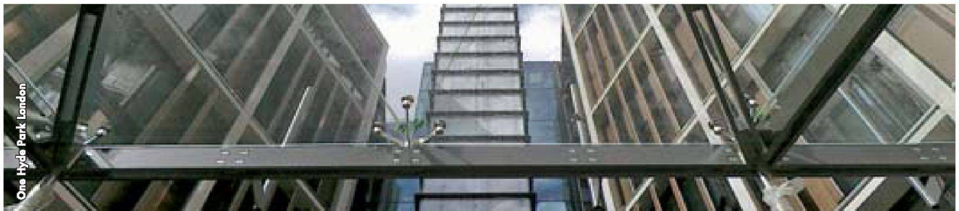
One Hyde Park London

JAKEM AG Industrie Breitenloh 2 CH-4333 Münchwilen