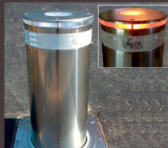
Poller UrbanStar Monaco