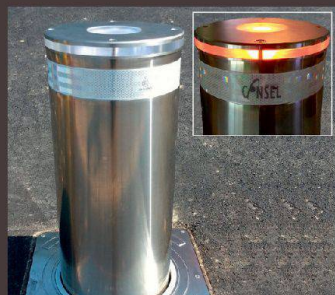
Poller UrbanStar Monaco