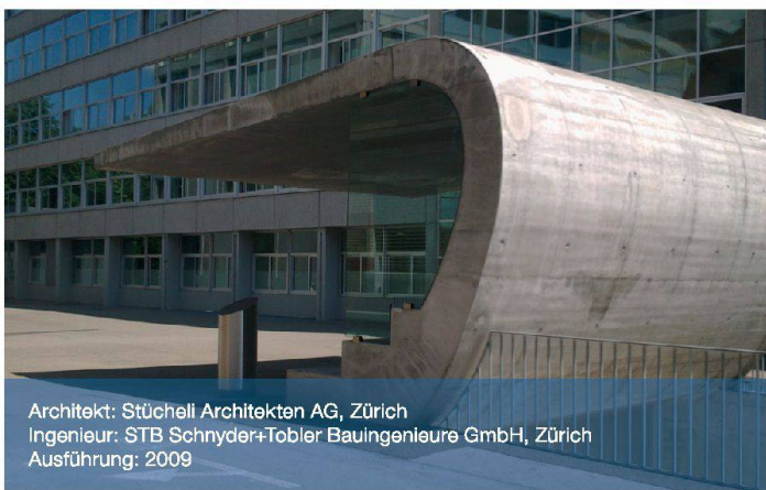
Architekt: Stücheli Architekten AG, Zürich Ingenieur: STB Schnyder+Tobler Bauingenieure GmbH, Zürich Ausführung: 2009

Oberflächenvariationen: Bei einer Villa in Küsnacht ZH wurde die äussere Bewehrung der gekratzten Kalksteinbetonfassade mit Top12 ausgeführt, um die Bewehrungsüberdeckung lokal stark um bis zu 15mm reduzieren zu können.