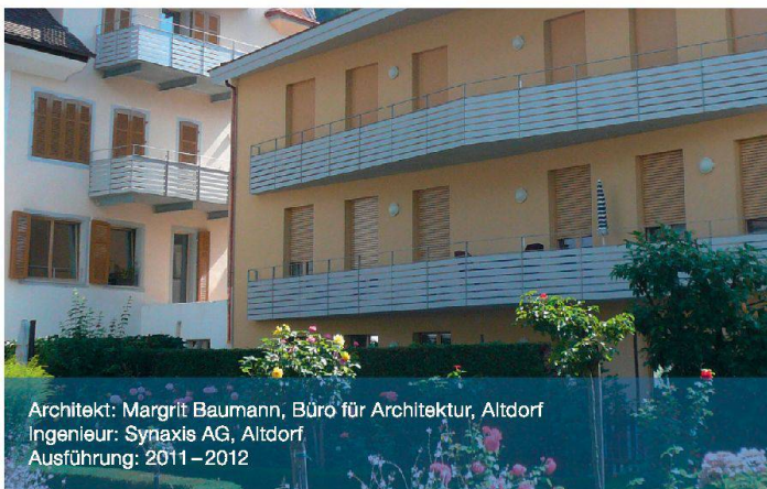
Architekt: Margrit Baumann, Büro für Architektur, Altdorf Ingenieur: Synaxis AG, Altdorf Ausführung: 2011–2012