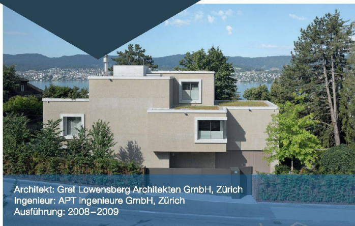
Architekt: Gret Lowenberg Architekten GmbH, Zürich Ingenieur: APT Ingenieure GmbH, Zürich Ausführung: 2008–2009