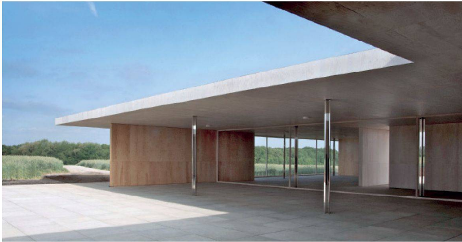
Nachbau des von Ludwig Mies van der Rohe 1930 in Krefeld geplanten Golfklubhauses. Den Initianten war es wichtig, den Bau am Originalstandort zu zeigen. Wegen eines Naturschutzgebiets ist er nun um 300 m verschoben.

Ludwig Mies van der Rohes 1930 entworfenen und nie realisiertes Golfklubhaus im nordrhein-westfälischen Krefeld wurde diesen Sommer als begehbare Modell nachgebaut. Bis zum 27. Oktober lässt sich der Bau besichtigen. Zurückhaltend materialisiert macht er die Essenz von Mies' Gedankengut erlebbar.