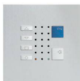
TC40 / Alu