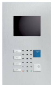
VTC40 / Alu

Video-Innensprechstellen aus edlem Metall – bilden einen Blickfang im gehobenen Innenausbau. Als Klein-ausführung im Schalterformat (Gr. 1+1) oder mit grösserem Farbdisplay für erweiterte Videoüberwachung. Die Frontplatten aus veredeltem Aluminium bestechen durch das klare Design und bleiben zeitlos wertbeständig. Die neueste Technik ermöglicht überall einen schlanken Einbau.