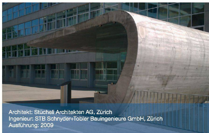
Architekt: Stücheli Architekten AG, Zürich Ingenieur: STB Schnyder+Tobler Bauingenieure GmbH, Zürich Ausführung: 2009

Oberflächenvariationen: Bei einer Villa in Küsnacht ZH wurde die äussere Bewehrung der gekratzten Kalksteinbetonfassade mit Top12 ausgeführt, um die Bewehrungsüberdeckung lokal stark um bis zu 15mm reduzieren zu können.