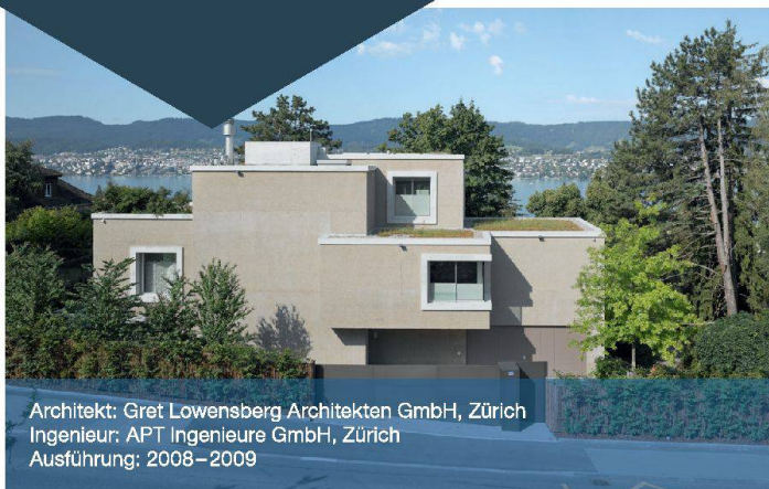
Architekt: Gret Lowenberg Architekten GmbH, Zürich Ingenieur: APT Ingenieure GmbH, Zürich Ausführung: 2008–2009