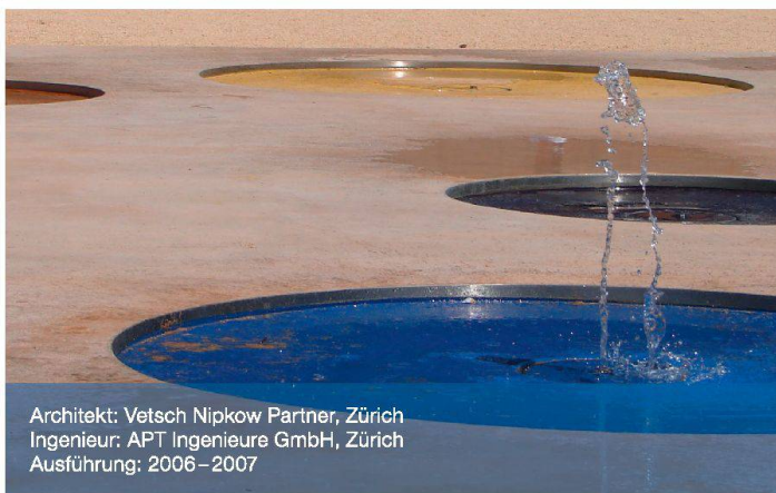
Architekt: Vetsch Nipkow Partner, Zürich Ingenieur: APT Ingenieure GmbH, Zürich Ausführung: 2006–2007