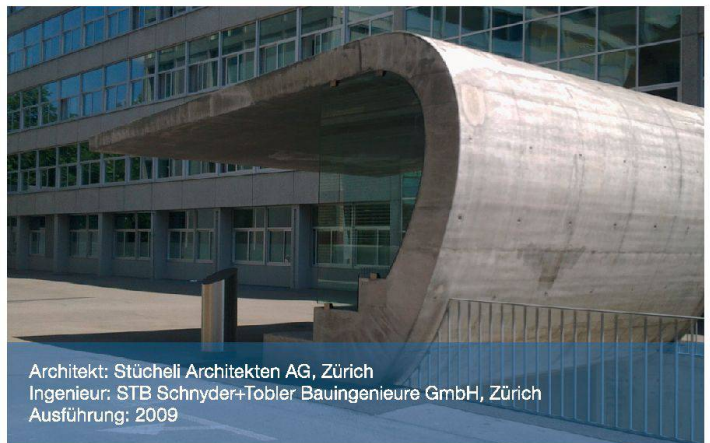
Architekt: Stücheli Architekten AG, Zürich Ingenieur: STB Schnyder+Tobler Bauingenieure GmbH, Zürich Ausführung: 2009

Oberflächenvariationen: Bei einer Villa in Küsnacht ZH wurde die äussere Bewehrung der gekratzten Kalksteinbetonfassade mit Top12 ausgeführt, um die Bewehrungsüberdeckung lokal stark um bis zu 15mm reduzieren zu können.