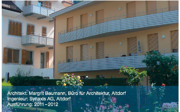
Architekt: Margrit Baumann, Büro für Architektur, Altdorf Ingenieur: Synaxis AG, Altdorf Ausführung: 2011–2012