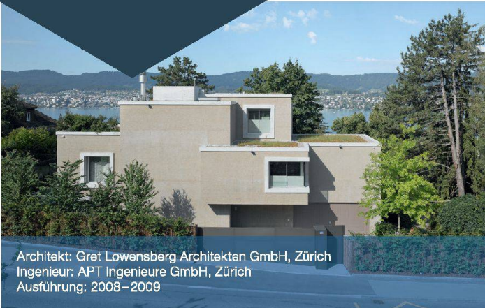
Architekt: Gret Lowenberg Architekten GmbH, Zürich Ingenieur: APT Ingenieure GmbH, Zürich Ausführung: 2008–2009