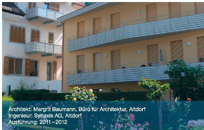
Architekt: Margrit Baumann, Büro für Architektur, Altdorf Ingenieur: Synaxis AG, Altdorf Ausführung: 2011–2012