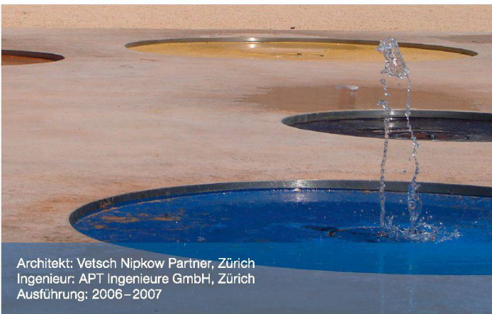
Architekt: Vetsch Nipkow Partner, Zürich Ingenieur: APT Ingenieure GmbH, Zürich Ausführung: 2006–2007