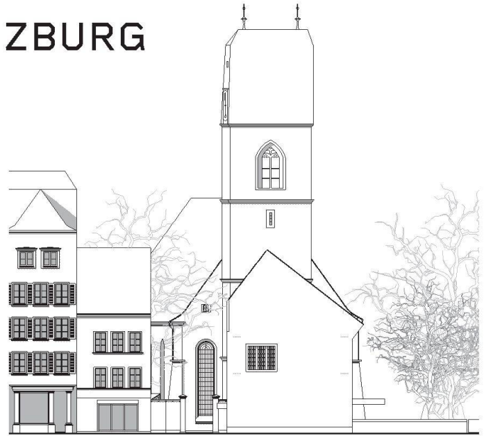
01-02 «Assemblage» (Froelich & Hsu Arch.): Das neue Gemeindehaus passt sich in die historische Nachbarschaft ein. Ansicht Ost, Mst. 1:200.

Das Team um Froelich & Hsu Architekten hat den Wettbewerb für den Neubau des neuen Pfarrhauses der reformierten Kirchgemeinde Lenzburg Hendschiken gewonnen.