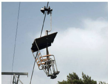
Die Weissenstein-Sesselbahn – die letzte ihrer Art – wird abgebrochen.

Das Schicksal des Sessellifts am Weissenstein ist besiegelt: Das Bundesverwaltungsgericht gab für den Abbruch des «Sesseli» grünes Licht.