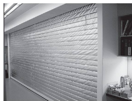
Brandschutz-Rolltore im Untergeschoss

Wir danken den SBB für den geschätzten Auftrag!