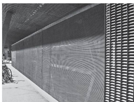
Bodenrollgitter als Nachtab schlüsse