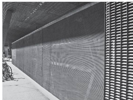
Bodenrollgitter als Nachtabschlüsse