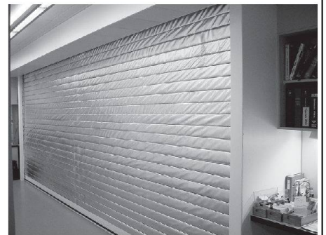
Brandschutz-Rolltore im Untergeschoss

Wir danken den SBB für den geschätzten Auftrag!