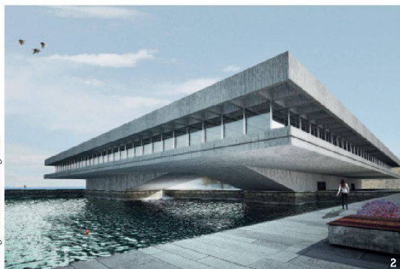
Immagine: Stefano Belinguardi