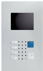
VTC40 / Alu

bilden einen Blickfang im gehobenen Innenausbau. Als Klein- ausführung im Schalterformat (Gr. 1+1) oder mit grösserem Farb- display für erweiterte Videoüberwachung. Die Frontplatten aus veredeltem Aluminium bestechen durch das klare Design und bleiben zeitlos wertbeständig. Die neueste Technik ermöglicht überall einen schlanken Einbau.