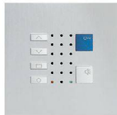
TC40 / Alu