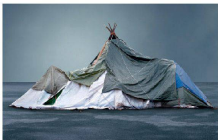
01 Erster Preis: «Die Entwicklung neuer Stadtquartiere im Herzen der City»

Zum zehnten Mal verleiht der Verein architektur bild e.V. den europäischen Architektur fotografie-Preis – diesmal zum Thema «Im Brennpunkt».