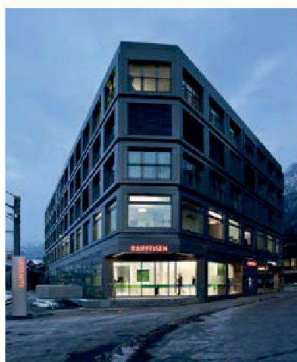
Modern und gediegen: Raiffeisenbank, Chur

Die FeuerschutzTeam AG und Ihre Partner bieten schweizweit Spezialtür-Systeme als Komplettlösung an – mit Beratung, Planung, Massfertigung und fachgerechter Montage aus einer Hand. Türelemente, Trennwandsysteme, Pendel-/Schiebetüren und Schachtwände sind in den Ausführungen Brand-, Rauch-, Schall- und Einbruchschutz sowie beschusshemmend verfügbar.