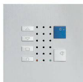
TC40 / Alu