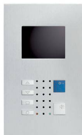
VTC40 / Alu

bilden einen Blickfang im gehobenen Innenausbau. Als Kleinausführung im Schalterformat (Gr. 1+1) oder mit grösserem Farbdisplay für erweiterte Videoüberwachung. Die Frontplatten aus veredeltem Aluminium bestechen durch das klare Design und bleiben zeitlos wertbeständig. Die neueste Technik ermöglicht überall einen schlanken Einbau.