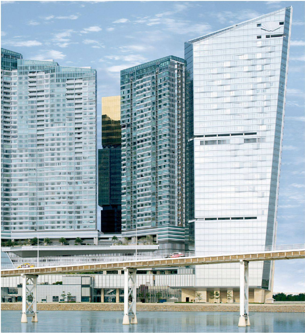
One Central, Macau