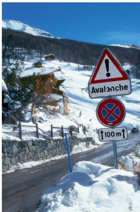
01 Evolène, fünf Tage nach dem Lawinenunglück vom Februar 1999, bei dem 12 Menschen ihr Leben verloren haben.

verbreiten. Solche offiziellen Warnungen würden sehr zurückhaltend eingesetzt, sagt Josef Hess. Bisher ist erst einmal, am 26. August 2011, eine verbreitungspflichtige Unwetterwarnung herausgegeben worden. Der prognostizierte Sturm hat sich jedoch weniger dramatisch entwickelt als erwartet. Der Lenkungsausschuss will vermeiden, dass die Aufmerksamkeit der Bevölkerung durch zu viele Warnungen nachlässt. Da man aber auch keine Ereignisse verpassen möchte, gleicht dies einer Gratwanderung. Bei Warnungen an die Bevölkerung sollten wenn immer möglich Referenzereignisse angegeben werden, sagt Hess. So könnten sich die Menschen besser vorstellen, was auf sie zukommt. Zudem sollten mögliche Auswirkungen des Ereignisses aufgezeigt und Handlungsempfehlungen genannt werden. An die Behörden und Führungsstäbe werden bereits für tiefere Gefahrenstufen und somit viel häufiger Warnungen verschickt. Mit ihren Fachleuten seien diese in der Lage, auch Meldungen mit Wahrscheinlichkeitsangaben zu interpretieren, sagt Hess. Die ab Gefahrenstufe 2 oder 3 verschickten Warnungen hätten vor allem zum Ziel, die Wachsamkeit der zuständigen kantonalen und kommunalen Fachstellen und Behörden zu erhöhen.