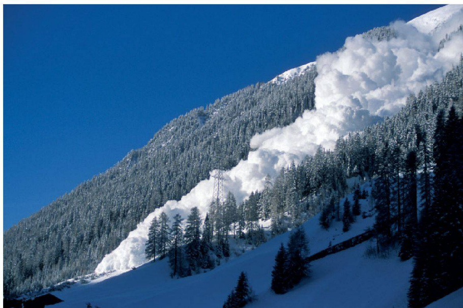
01 Lawinenniedergang im sogenannten Breitzug in der Landschaft Davos. Hier werden immer wieder künstliche Lawinen ausgelöst.

Wie Wahrscheinlichkeiten von Naturgefahren kommuniziert werden sollen und wie im konkreten Fall zu warnen ist, stellt eine grosse Herausforderung dar. Weltweites Aufsehen erregte die Verurteilung von sechs italienischen Seismologen in Zusammenhang mit dem Erdbeben von L'Aquila. Schweizer Naturgefahrenexperten erwarten jedoch keine direkten Auswirkungen für die Arbeit der Warndienste in der Schweiz.