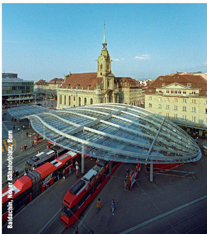
Baldachin, Neuer Bahnhofplatz, Bern

Partner für anspruchsvolle Projekte in Stahl und Glas