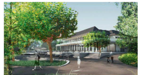
09 Zwimpfer Partner Architekten