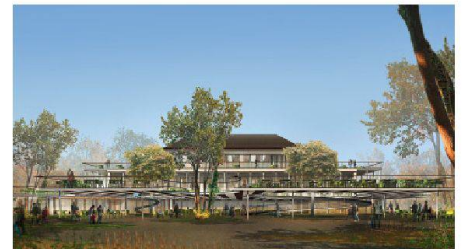
07 Harry Gugger Studio