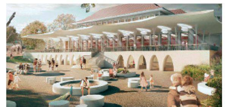
08 Luca Selva Architekten