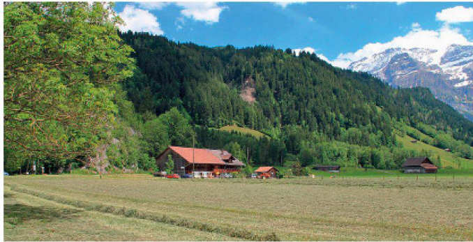
01 Bestehendes Wohnheim im ehemaligen Bauernhaus