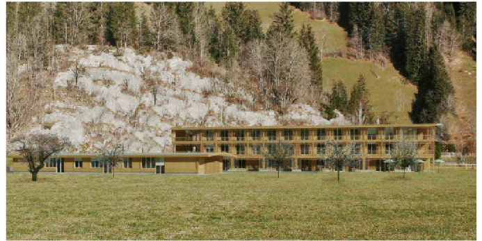
02 «Philemon & Baucis» (Bienert Kintat Architekten): Blick von Westen

Bauernhausopfer: Das Team um Bienert Kintat Architekten gewinnt den Wettbewerb mit einem zweiteiligen Neubauensemble. Das alte Bauernhaus, das seit 1998 das Wohnheim Bergquelle beherbergt, wird im besten Fall transloziert.