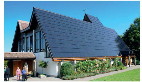
06 Kategorie Institutionen/Persönlichkeiten: Die Jury lobt die dachflächenintegrierte PV-Anlage der ökumenischen Kirche in Halden als Vorbild für sanierungsbedürftige Kulturbauten.

Aus 80 eingereichten Bewerbungen zeichnete die 41-köpfige Jury beim 22. Schweizer Solarpreis insgesamt 25 Projekte in sieben Kategorien aus – hinzu kamen noch zwei Sonderpreise.