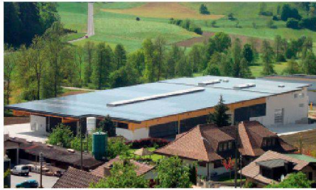
04 PlusEnergieBau-Solarpreis: Die PV-Anlage des Geschäftshauses Affentranger in Altbüren LU erzeugt einen grossen Überschuss, der künftig zur Wasserstoffherstellung genutzt werden soll.