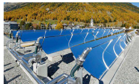
03 Kategorie Anlagen: Auf dem Dach der Lateria Engiadinaisa in Bever GR erzeugt eine 65-kW-Hochtemperatur-Solaranlage Dampf für die Milchverarbeitung und spart so 7000 l Heizöl.

Der Schweizer Solarpreis 2012 zeichnet insgesamt 27 Projekte aus – nicht nur die erzielten Energieerträge sind dabei erfreulich hoch, sondern auch die gestalterische Qualität der Plusenergiebauten (PEB).