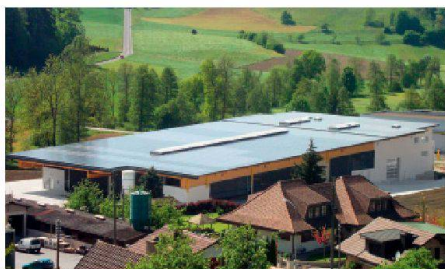
04 PlusEnergieBau-Solarpreis: Die PV-Anlage des Geschäftshauses Affentranger in Altbüren LU erzeugt einen grossen Überschuss, der künftig zur Wasserstoffherstellung genutzt werden soll.