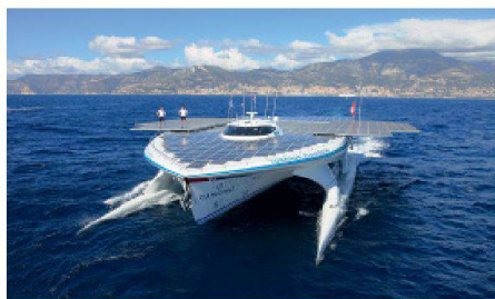
01 Kategorie Institutionen/Persönlichkeiten: Mit einer 537 m 2 grossen, 93.5 kWp leistenden PV-Anlage hat die «MS Türanor PlanetSolar» die Welt umrundet.