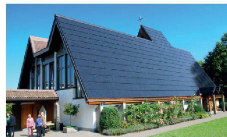
06 Kategorie Institutionen/Persönlichkeiten: Die Jury lobt die dachflächenintegrierte PV-Anlage der ökumenischen Kirche in Halden als Vorbild für sanierungsbedürftige Kulturbauten.

Aus 80 eingereichten Bewerbungen zeichnete die 41-köpfige Jury beim 22. Schweizer Solarpreis insgesamt 25 Projekte in sieben Kategorien aus – hinzu kamen noch zwei Sonderpreise.