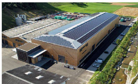
02 Kategorie Neubauten: Das Holzwerk Renggli in Schötz LU erreicht mit seinen total 303 kWp leistenden PV-Anlagen auf dem Dach und an der Südfassade 95 % Eigenenergieversorgung.