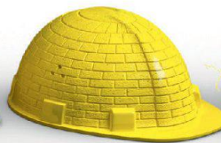
Mauerwerk & Bauteile