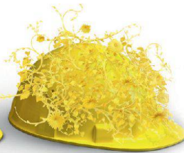
Nachhaltigkeit & Innovation

Auf die Erstellung hochkomplexer Klinker- und Sichtsteinfassaden haben wir unser Fundament gebaut. Dass wir visionär denken und entsprechend planen und realisieren, beweisen wir täglich in sämtlichen Bereichen unserer Geschäftsfelder. Wir schaffen Mehrwert, mit System am Bau: www.keller-ziegeleien.ch