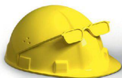
Planung & Ausführung