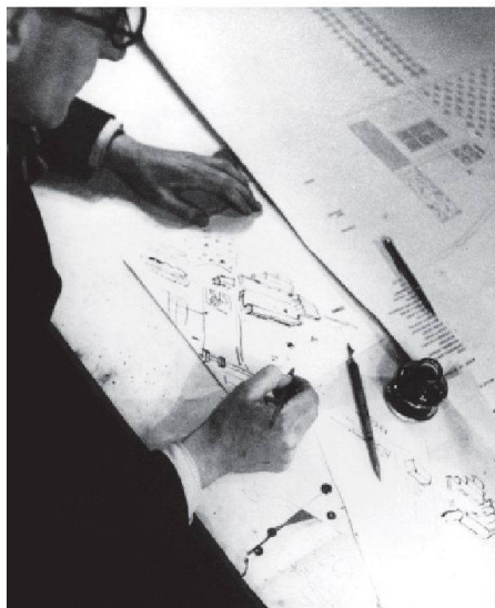
01 Le Corbusier (1887 – 1965) beim Skizzieren, 1935