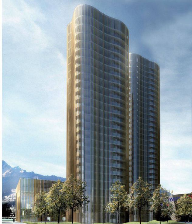
Swisspor-Arena, Luzern, Stadion, Hochhäuser + Sportgebäude Architekten: Daniele Marques/Iwan Bühler, Luzern

Alphabeton-Stützen nehmen es mit jeder Belastung auf