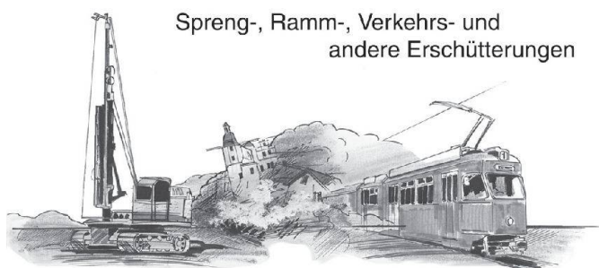
Spreng-, Ramm-, Verkehrs- und andere Erschütterungen