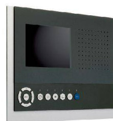
skyline plus UP

René Koch AG 8804 Au/Wädenswil 044 782 6000 info@kochag.ch www.kochag.ch