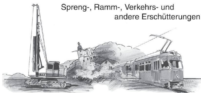
Spreng-, Ramm-, Verkehrs- und andere Erschütterungen