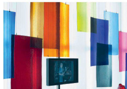
02 In der Glashütte Lamberts in Walldorf (D) wird im Mundblas-Verfahren farbiges Flachglas für Restaurationen hergestellt. Die Farbpalette umfasst 230 Standardfarben und 5000 Rezepturen

In der Ausstellung zeigen Materialbeispiele und Videos den gegenseitigen Einfluss von Architektur und Entwicklungen in der Flachglasproduktion – vom gotischen Sakralbau bis zur interaktiven Glasfassade. Auch die Herstellung verschiedener Glastypen wird erläutert. Neben der handwerklichen und der industriellen Produktion von Glas thematisiert die Schau dessen Verwendung in Medizin