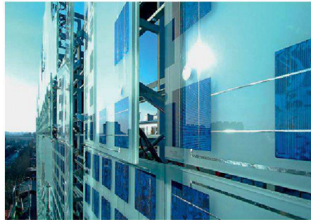
01 Zero Energy Media Wall, Peking (2008). Architektur: Simone Giostra & Partners Architects, New York; Fassade: Arup. Die Frontfassade des Xicui Unterhaltungszentrums dient als Sonnenschutz, zur Energiegewinnung und als LED-Display

Glas kann nicht nur das Aussehen eines Gebäudes bestimmen, sondern übernimmt immer öfter auch funktionale Aufgaben. Ein Beispiel ist der Hauptsitz der Swiss Re in London von Foster+Partners («The Gherkin»): Gesteuerte Lüftungsflügel und unterschiedliche