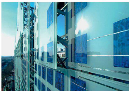
01 Zero Energy Media Wall, Peking (2008). Architektur: Simone Giostra & Partners Architects, New York; Fassade: Arup. Die Frontfassade des Xicui Unterhaltungszentrums dient als Sonnenschutz, zur Energiegewinnung und als LED-Display

Glas kann nicht nur das Aussehen eines Gebäudes bestimmen, sondern übernimmt immer öfter auch funktionale Aufgaben. Ein Beispiel ist der Hauptsitz der Swiss Re in London von Foster+Partners («The Gherkin»): Gesteuerte Lüftungsflügel und unterschiedliche