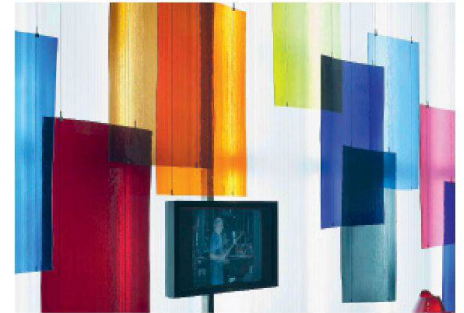
02 In der Glashütte Lamberts in Waidsassen (D) wird im Mundblas-Verfahren farbiges Flachglas für Restaurationen hergestellt. Die Farbpalette umfasst 230 Standardfarben und 5000 Rezepturen

In der Ausstellung zeigen Materialbeispiele und Videos den gegenseitigen Einfluss von Architektur und Entwicklungen in der Flachglasproduktion – vom gotischen Sakralbau bis zur interaktiven Glasfassade. Auch die Herstellung verschiedener Glastypen wird erläutert. Neben der handwerklichen und der industriellen Produktion von Glas thematisiert die Schau dessen Verwendung in Medizin