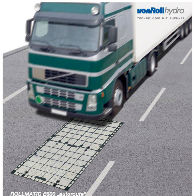
ROLLMATIC E600 „autoroute“