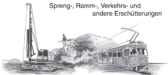
Spreng-, Ramm-, Verkehrs- und andere Erschütterungen

http://www.patrimoine.vd.ch/monuments-et-sites/eglises/cathedrale-de-lausanne/accueil/