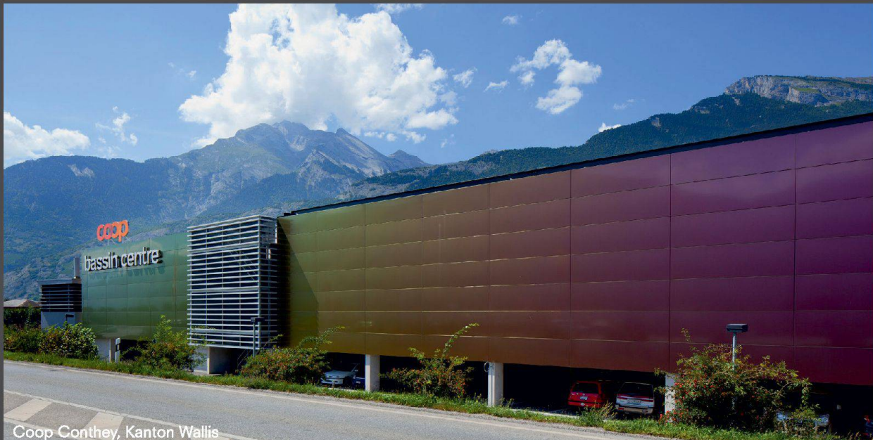
Coop Conthey, Kanton Wallis

Inspirierende Farbfülle und außergewöhnliche Oberflächenvielfalt